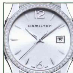
La conferenza stampa, Valeria Lodovini, l'orologio.