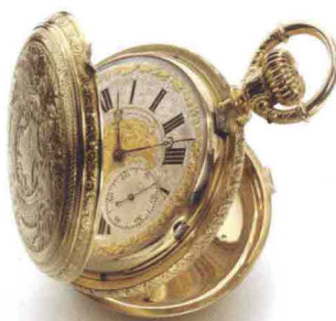
Un prezioso Tasca del 1869.