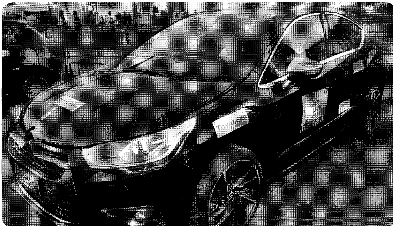
Nella foto, la Citroën DS4 Auto Europa 2012